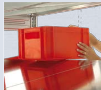
Einfaches Beschicken der Regale nach dem FIFO-Prinzip.