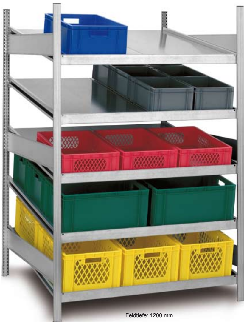
Feldtiefe: 1200 mm