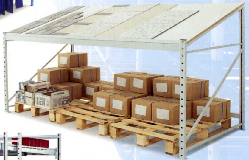
FLIVOL FLIESENREGAL (ideal für Baumärkte)